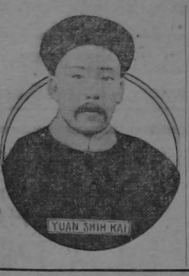
YUAN SHIH KAI

Pekín, 25.—Durante un almuerzo en que estaba el señor Presidente, los miembros del Gabinete y altas personalidades, un individuo Chang Pin Clin, penetró misteriosamente al comedor y disparó sobre el Presidente que se mostró calmadísimo, no moviéndose de su asiento hasta que el individuo apuntó los tiros de su pistola. Los mozos capturaronlo entregándolo a la policía. Los disparos no causaron daño.